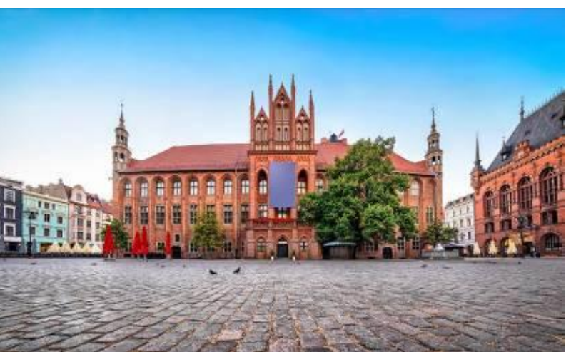
บ้านเรือนสมัยยุคกลางจนได้รับการยกย่องให้เป็นเมืองมรดกโลกในปี